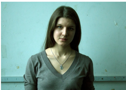
В мастерской 2014